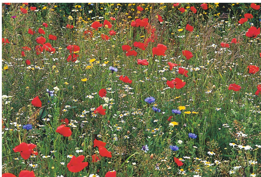
Mohn und Kornblumen zeigen sich in einer neu angelegten Wiese nur im ersten Jahr. Sie sind „Platzhalter“ für Wildblumen, die eine längere Entwicklungszeit haben und sich dann später durchsetzen

Nachdrucke (auch auszugsweise) nur nach Zustimmung der Herausgeber und Autoren.