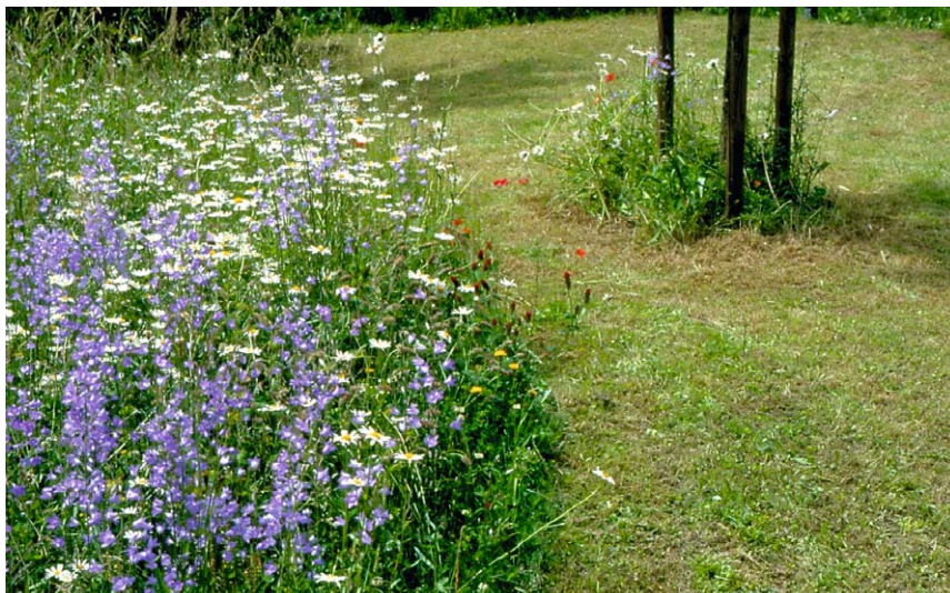
Wer einen großen Garten hat, kann einen Teil der Grünfläche als Rasen nutzen und auf dem anderen Teil eine Blumenwiese anlegen

können. Die seit Jahren im Boden ruhenden Samen können ungestört ans Licht gelangen und keimen. Fünf bis zehn Jahre vergehen, bis eine natürliche Blumenwiese entstanden ist, deren Artenreichtum in der Folgezeit weiter zunimmt.