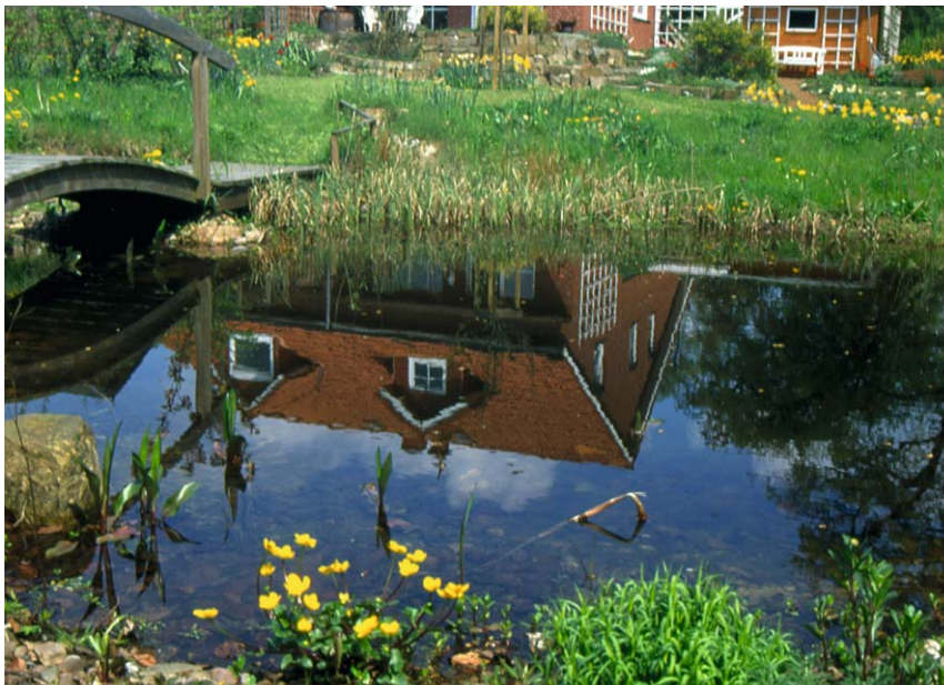
Zu einem naturnahen Garten gehört ein Teich dazu, denn er ist Lebensraum für vielerlei Pflanzen und Tiere

Gartenteiche können grundsätzlich zu jedem Zeitpunkt außerhalb der Frostperiode angelegt werden. Das späte Frühjahr wäre die günstigste Zeit für die Bepflanzung. Ein späterer Zeitpunkt hat bei der Gewässeranlage den Vorteil, dass die durch die höheren Temperaturen geschmeidigeren Folien sich leichter verarbeiten lassen.