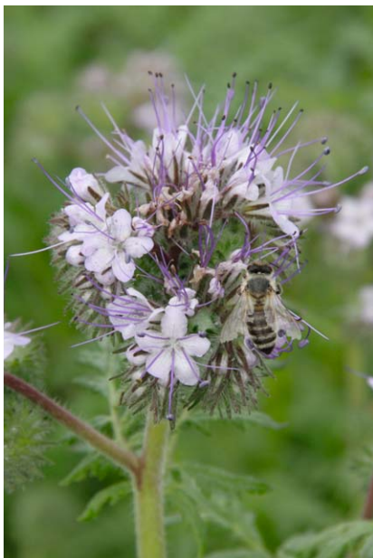
Phacelia ist eine wertvolle Bienenfutterpflanze und trägt daher auch zu Recht den Namen „Bienenfreund“

Unbedeckte Böden sind schutzlos Witterungseinflüssen ausgesetzt und verlieren dabei schnell an Fruchtbarkeit. Durch Aussaat von Gründüngungspflanzen als Zwischen-, Vor- oder Nachkultur kann der Boden ganzjährig bedeckt werden – eine wichtige Maßnahme, die zum Bodenschutz beiträgt. Zudem wird der Boden wirkungsvoll mit Humus versorgt.