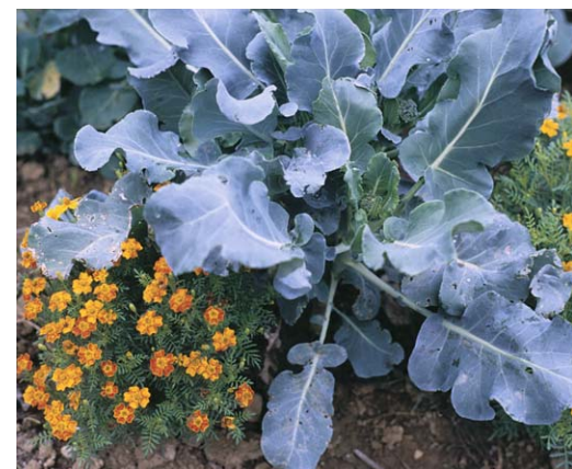
Gründüngung kann auch dekorativ sein: hier bringen Studentenblumen Farbe ins Kohlbeet