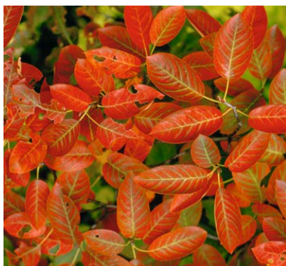
Die Kanadische Felsenbirne ( Amelanchier canadensis ) bringt mit ihrer Laubfärbung im Herbst einen Hauch von „Indian Summer“ in den eigenen Garten

Schwere Böden werden gründlich gelockert, verdichtete und aufgeschüttete Böden z.B. durch eine Gründüngung verbes-