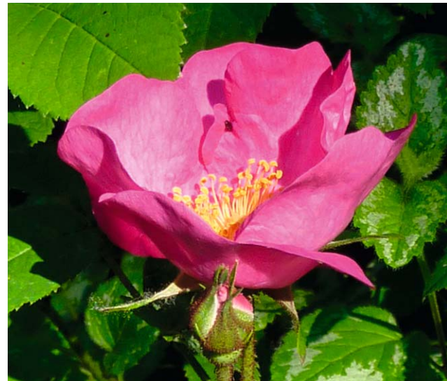
Die Essig-Rose ( Rosa gallica ) lockt mit ihren zauberhaften Blüten zahlreiche Insekten an, und im Herbst liefern ihre Hagbutten Vögeln Nahrung

Für die Auswahl von Gehölzen ist es deshalb wichtig, sich über Wuchseigenschaften und Standortansprüche der zur Verfügung stehenden Arten zu informieren. Auch andere Eigenschaften wie Blüte, Fruchtbildung und ökologische Bedeutung sollten bekannt sein.