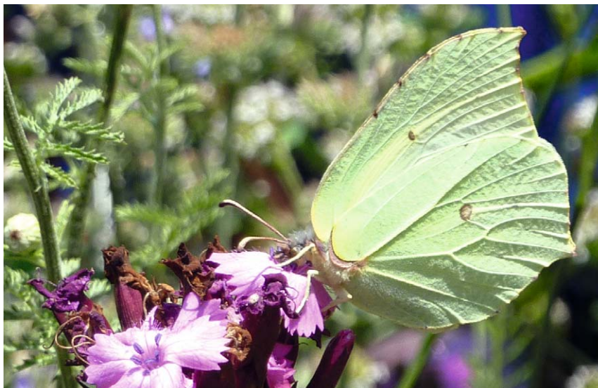
Der Zitronenfalter lässt sich den Nektar der Karthäusernelke schmecken

von Gebüsch, ist also ein wirksamer Beitrag zum Schmetterlingsschutz im Garten!