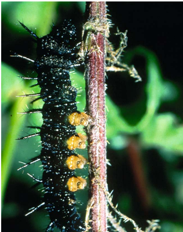
Das Tagpfauenauge (unten die Raupe, oben der ausgewachsene Falter) ernährt sich ausschließlich von Brennnesseln und findet daher in „aufgeräumten“ Gärten keine Nahrung

Manche Schmetterlinge sind sehr wählerisch. Schon die Eier werden nur an besonderen Raupenfutterpflanzen abgelegt. Die Raupen beißen mit ihren Fresszangen die Blätter an und verzehren davon bis zu ihrer Verpuppung große Mengen.